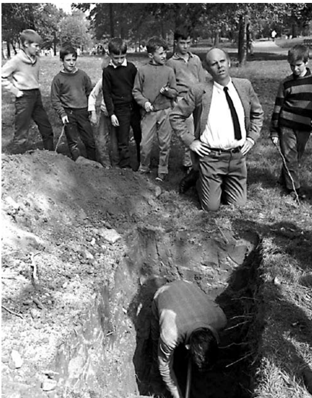
1. Claes Oldenburg, Sculpture in Environment: Placid Civic Monument , Central Park, New York, 1967.

Claes Oldenburg, Sculpture in Environment: Placid Civic Monument , Central Park, New York, 1967